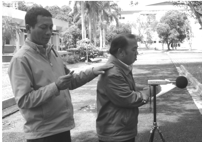
Gambar 1 Pengukuran secara Langsung

L_{pAi} adalah tingkat tekanan bunyi sesaat rata-rata dalam interval 5 detik